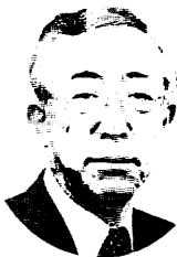
尾張旭市市長 谷口幸治

おわりに、同窓会の皆様方の今後益々のご活躍・ご健勝を祈念して簡単ではございますが、私のご挨拶とさせていただきます。